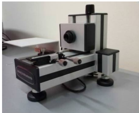
Rys.2. Stanowisko pomiarowe do analizy kąta zwilżania i wyznaczenia SEP

Pomiar kąta zwilżania został zrealizowany na stanowisku badawczym złożonym z aparatu firmy Advex Instruments z kamerą do wykonywania zdjęć kropli cieczy naniesionej na warstwę wierzchnią powierzchni próbki oraz programu See System służącego do analizy zarejestrowanego obrazu kropli (rys.2). W trakcie badań наносono krople cieczy pomiarowych, za pomocą mikropipety, o objętości 4,5 [μl]. Wykonano pomiary kąta zwilżania (rys.3) wodą destylowaną ( \theta_w ) oraz diiodometanem ( \theta_d ). Przyjęte do obliczeń wartości swobodnych energii powierzchniowych (SEP) oraz ich składowe: polarną i dyspersyjną dla metody Owens'a-Wendt'a podano w tabeli 1. Pomiar wszystkimi cieczami wykonano co najmniej 10 razy dla wszystkich badanych próbek.