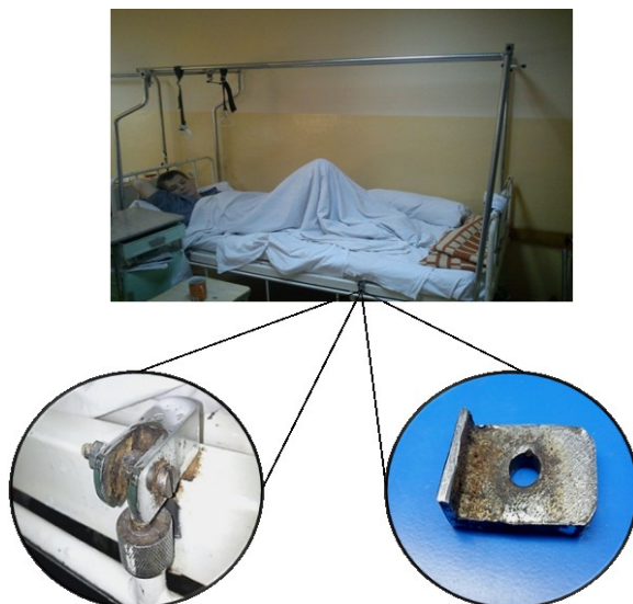
Rys.1. Łóżko rehabilitacyjne. Elementy łóżka rehabilitacyjnego z „ogniskami” korozji