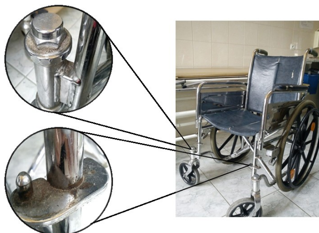
Rys.2. Wózek inwalidzki z elementami miejscowej korozji